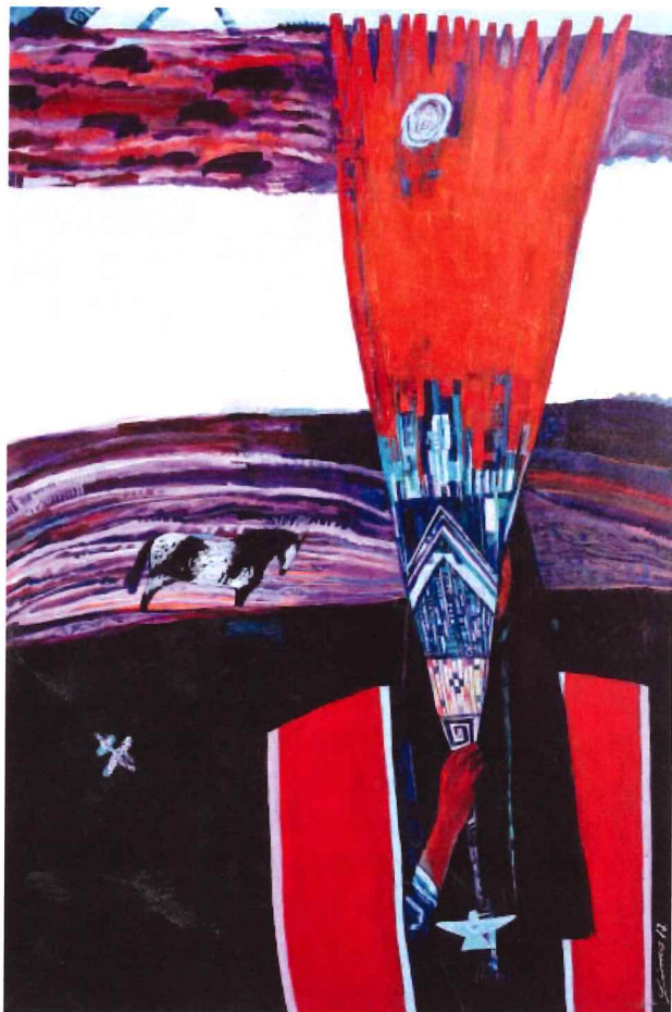
Linus Woods (b. 1967) He Who Shows the Road, 2012 Mixed media on canvas Collection: Manitoba Hydro

fins qui recouvre Terre Mère; un énorme aigle plane au-dessus. Le personnage dans l'œuvre intitulée He Who Shows the Road tient un éventail richement orné de plumes que l'on utilise lors des cérémonies de guérison; la terre fournit un arrière-plan nourrissant. Autant M. Woods interprète ses propres rêves et les histoires de sa communauté, autant il réfléchit à l'avenir et à notre place en tant que collectivité au sein de celui-ci. Les œuvres telles que Speed of Light dépeignent sa propre idée de la cosmologie et la possibilité que d'autres êtres habitent notre