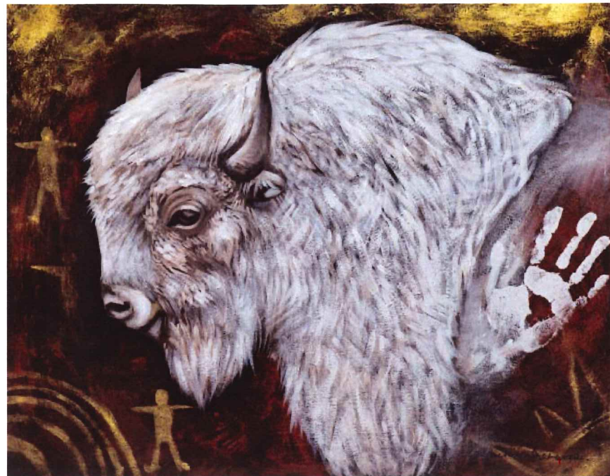
Jackie Traverse (b. 1969) White Buffalo Calf, 2012 Acrylic and mixed media on canvas

University of Manitoba as an adult in 2009. Sacred teachings, the turtle and the raven figure prominently in her work. Traverse has embraced bold colour and strong lines in paintings of birds and animals as well as her more abstract pieces. Ravens are beautifully rendered in black with shiny blue in their feathers, ruffled and worn looking. The birds look tough, yet vulnerable, with an inner strength and nobility. Ungainly, with ruffled feathers, they stare at us with unflinching dignity. White Buffalo Calf references the story of White Buffalo Woman who brought the seven sacred rituals to the Lakota people. After teaching her people, she left, promising to return one day. Traverse has included her own hand print in the painting to emphasize the connection between the sacred and the human. There is a strong spiritual connection to what she creates, which she hopes will encourage dialogue around the social and historical issues facing aboriginal people today.