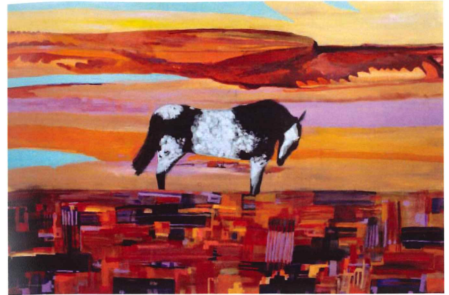
Linus Woods (b. 1967) Buffalo Runner , 2011 Mixed media on canvas Collection: Manitoba Hydro

une grande partie de sa vie dans le quartier nord de Winnipeg. Sa mère s'éteint lorsqu'elle est enfant et elle est séparée de ses frères et sœurs, tous adoptés par des familles non autochtones dans les années 1970. Elle veut devenir artiste depuis l'enfance et elle finit par obtenir son diplôme en beaux-arts à l'Université du Manitoba en 2009. Les enseignements sacrés, la tortue et le corbeau occupent une place prépondérante dans ses œuvres. Mme Traverse adopte l'usage de couleurs vives et de lignes fortes dans les peintures d'oiseaux et d'animaux ainsi que dans ses œuvres à caractère abstrait. Les corbeaux sont magnifiquement rendus, grâce au noir et au bleu luisant qu'elle choisit pour leurs plumes, à l'apparence froissée et usée. Les corbeaux ont l'air menaçants et vulnérables et, en même temps, munis d'une grande force intérieure et d'une noblesse. Disgracieux, les corbeaux aux plumes ébouriffées nous fixent d'un regard rempli de dignité stoïque. Le tableau intitulé White Buffalo Calf