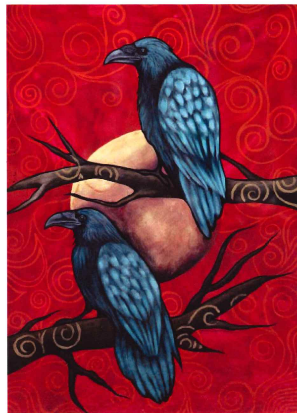
Jackie Traverse (b. 1969) Untitled, 2012 Acrylic on paper

Les œuvres de Jackie Traverse sont influencées par son expérience en tant que femme autochtone, une Anishnaabe originaire de la Première nation du lac St-Martin, au Manitoba, mais qui vit