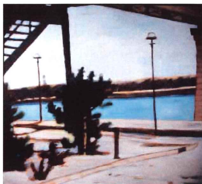
Brigitte Dion Under the Train Bridge

des créations uniques qui comportent néanmoins des points de convergence et de divergence.