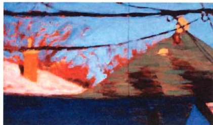
Brigitte Dion October Light

Avec son traitement non figuratif de la couleur, Lafrenière crée des paysages faits de textures épaisses et de figures de composition. Ces blocs de couleur énigmatiques forment des balises qui orientent la méditation, invitant à la réflexion libre et à l'interprétation personnelle des espaces.