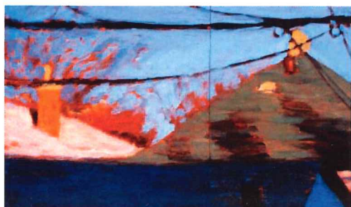
Brigitte Dion October Light

As a result of his non-representational approach to colour, LaFrenière's landscapes are composed of thick textures and compositional shapes. These unidentifiable blocks of colour act as peripheral points of meditation, which invite open-ended thoughts and interpretations in relation to prairie spaces.