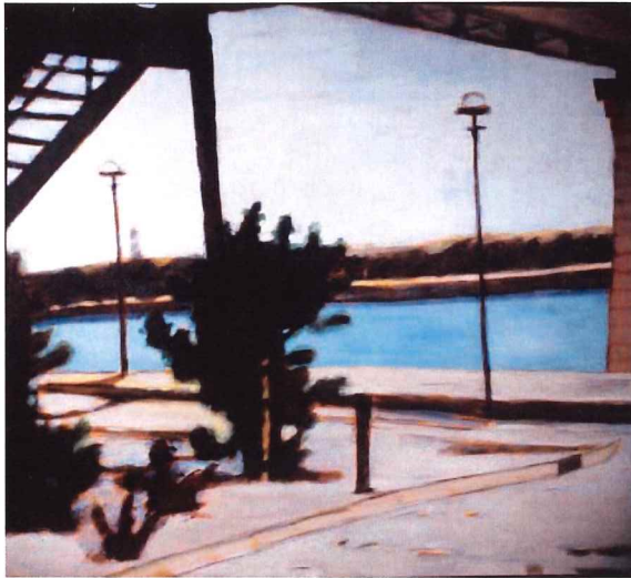
Brigitte Dion Under the Train Bridge

photograph it; it will be a wonderful late afternoon sky.” She also focuses on the super-imposed human-built environment, buildings, roof tops, bridges and lamp standards, emphasizing their contrasts to the natural forms. The repetition of telephone poles and lights both reflect